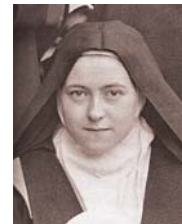
Fotografie der hl. Theresia