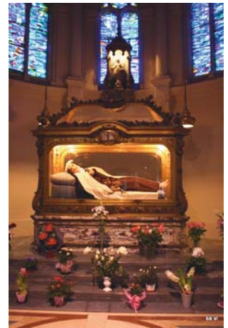
Schrein der Heiligen im Karmel von Lisieux

Eine Heilige, die bis in unsere Tage viele Menschen anspricht und für sie Wegbegleiterin ist.